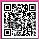
いまのリシリーズ紹介動画はこちら!